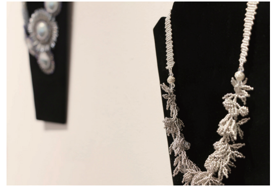
セーラムギャラリー(チェルシー, NY)にて行われた展示風景

この度、Gallery t では、「JAPAN SEED BEADERS」展を開催いたします。本展は、2014年6月、NY チェルシーに所在地のあるセーラムギャラリーにて、ビーズアートジャパン大賞2013[*1]、ビーズビエンナーレ2013[*2]の大賞の副賞として開催された展覧会(会期:2014/6/10-14、主催:ビーズアートジャパン大賞実行委員会、ビーズビエンナーレ実行委員会)の巡回展です。また、ジャパン シード ビーダー/Japan seed beader[*3]として、22名のシードビーズアーティストにもセーラムギャラリーでの展示へご参加をいただきました。6月10日のオープニングレセプションには、ビーズアーティスト、現代アート収集家を含む数多くの方にお越しいただきました。NYでも大変高く評価された日本のビーズアーティストの作品群をぜひこの機会にご高覧頂きますようお願い申し上げます。